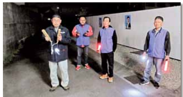
河崎地区で25人が参加して防火夜間パトロールを実施