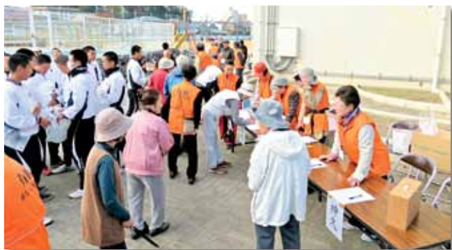
ごみゼロウォーク参加者受付風景