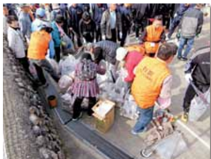
参加者の方々が収集したごみを整理