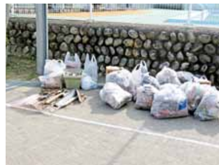
第3回ごみゼロウォーク河崎で収集されたごみ