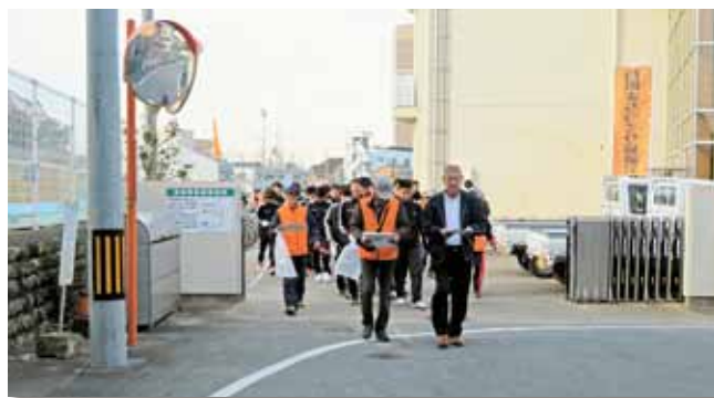
河崎地区のごみゼロウォークに出発