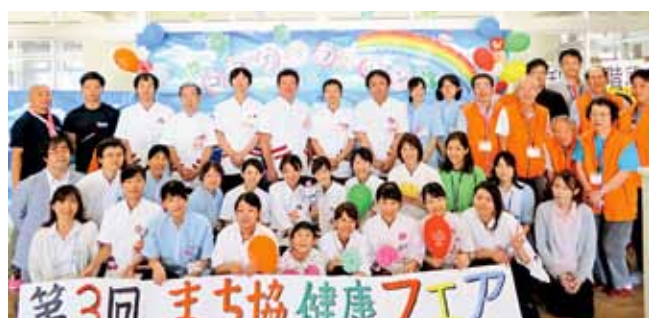
まち協関係者と協力団体のみなさん