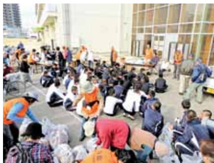
ごみゼロウォークに参加された伊勢工業高校の生徒さんたち