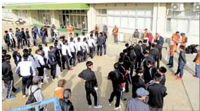
出発前にごみゼロウォークを説明