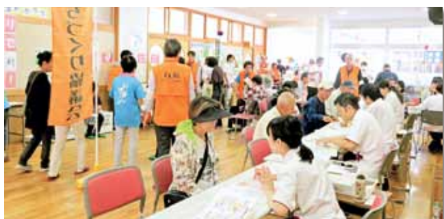
ココカラファイン薬局さんの 薬剤師による健康相談