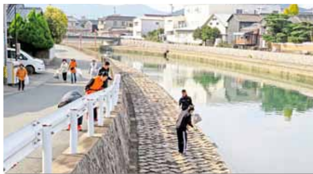
勢田川沿いでごみ収集するみなさん