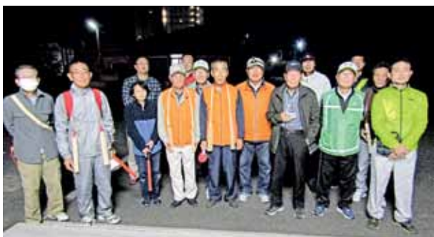
神久地区で17人が参加して防火夜間パトロールを実施