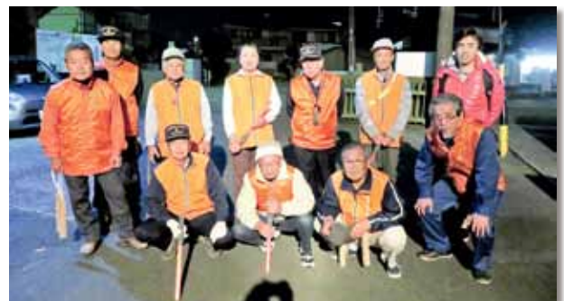
船江地区で11人が参加して防火夜間パトロールを実施