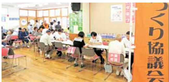
ココカラファイン薬局さんの 薬剤師による栄養&お薬相談