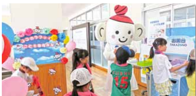
こども薬局を体験するこどもたち