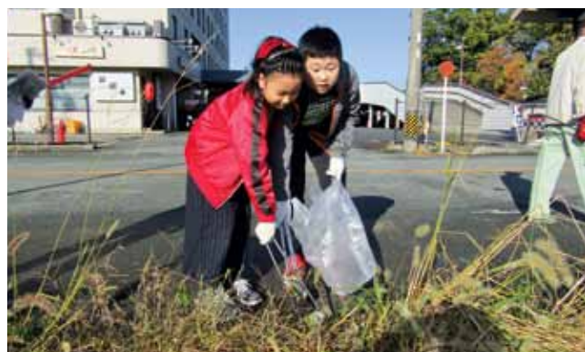
協力して投棄された空き缶を回収する子供たち