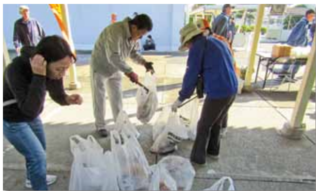
回収されたごみを整理する皆さん