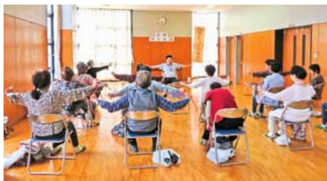
㈱森伸さんの介護福祉士による健康体操