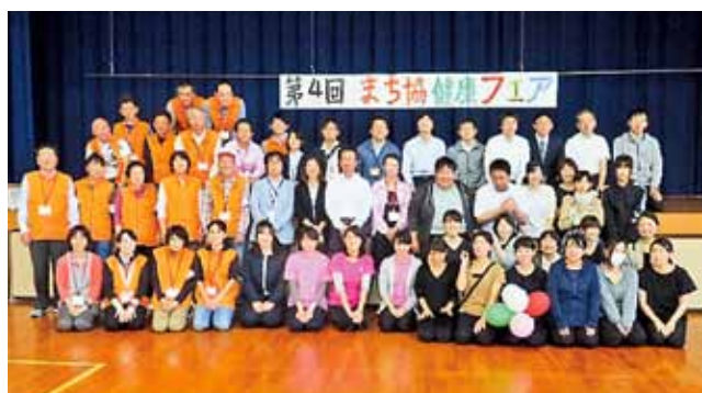
まち協関係者と協力団体のみなさん