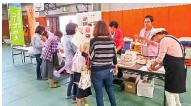
コープみえさんによる味覚チェックや健康クイズ