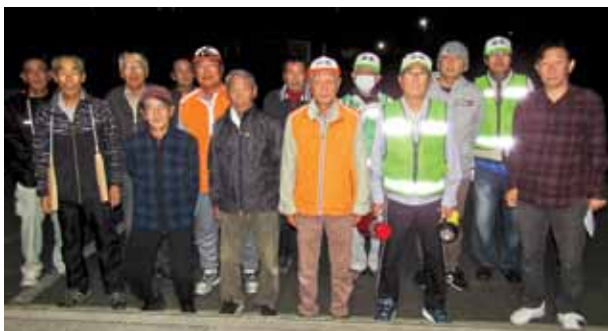
11月2日、神久地区で15人が参加して防火週間夜間パトロールを実施