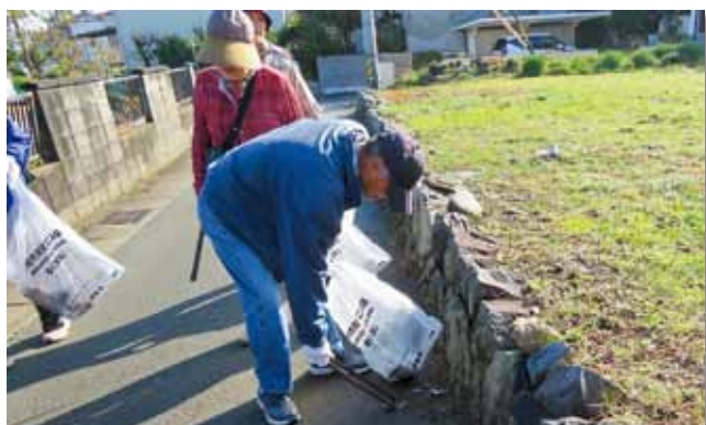
道端のごみを回収する参加者