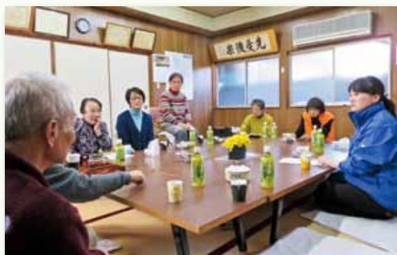
河崎地区で開催された「まち協 福祉なんでも相談事業・三世代交流事業」の風景

ぜひ一度 立ち寄ってね お茶でもしながら しゃべりましょう 親子で！ お孫さんと一緒に！ 楽しく遊ぼう！