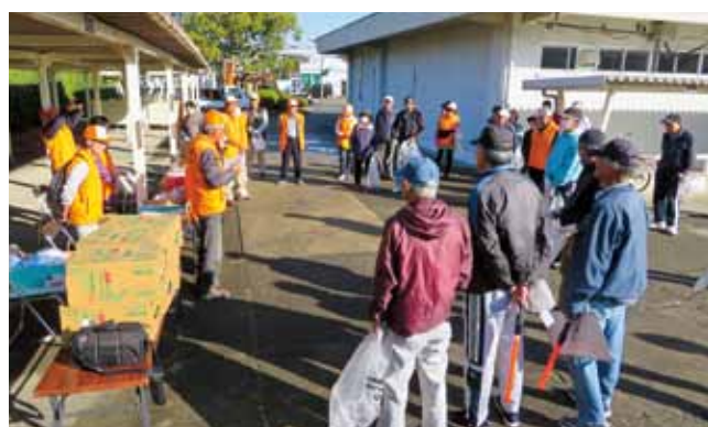
出発前にごみゼロウォークの注意事項を参加者に説明