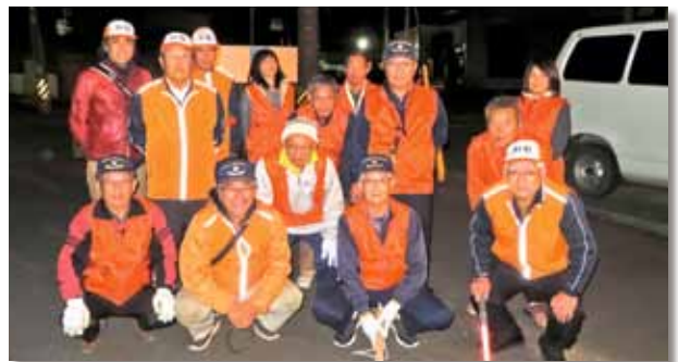
11月9日、船江地区で15人が参加して防火週間夜間パトロールを実施