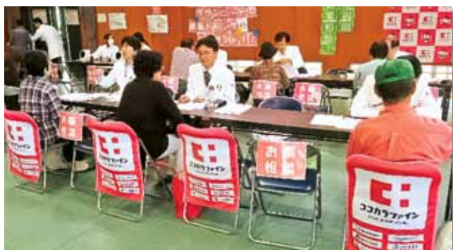
ココカラファイン薬局さんの薬剤師によるお薬相談

会場で、参加者にアンケートをお願いした結果、まち協健康フェアに対して88%の方々为满足と回答されました。