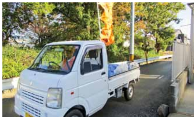
軽トラックに有緝まちづくり協議会ののぼり旗を掲げてごみを回収