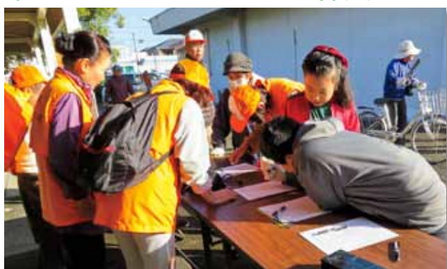
第4回ごみゼロウォーク参加者の受付風景