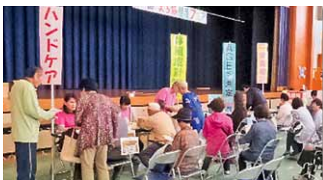
中北薬品さんの管理栄養士による栄養相談など