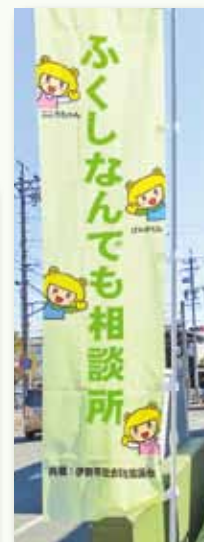
福祉なんでも相談所のぼり旗