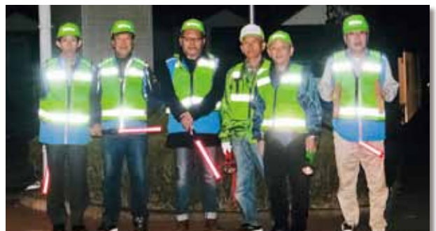
11月9日、河崎地区で23人が参加して防火週間夜間パトロールを実施